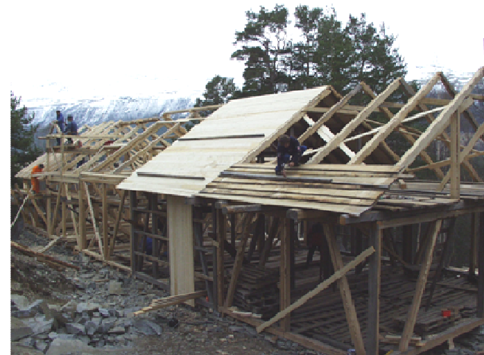
Den store dagen. Bygget reiser seg.

LÅVEN er og vil bli eit viktig hjelpemiddel i dette å styrke handverka og tradisjonane kring dei .