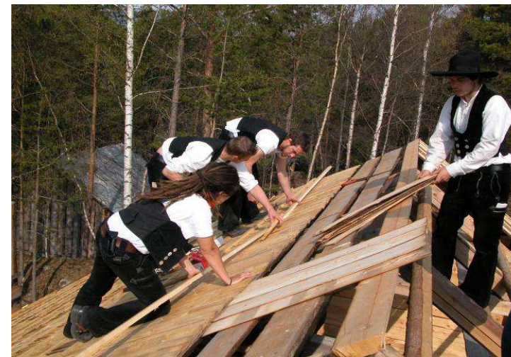
Mange har vore med. Her er det tyske gesellar som tekker.